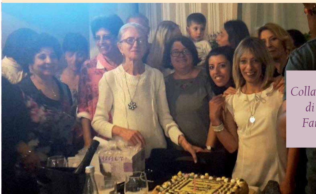
Collaboratori di Casa Famiglia

Con affetto e stima.....tutti noi di Casa Famiglia