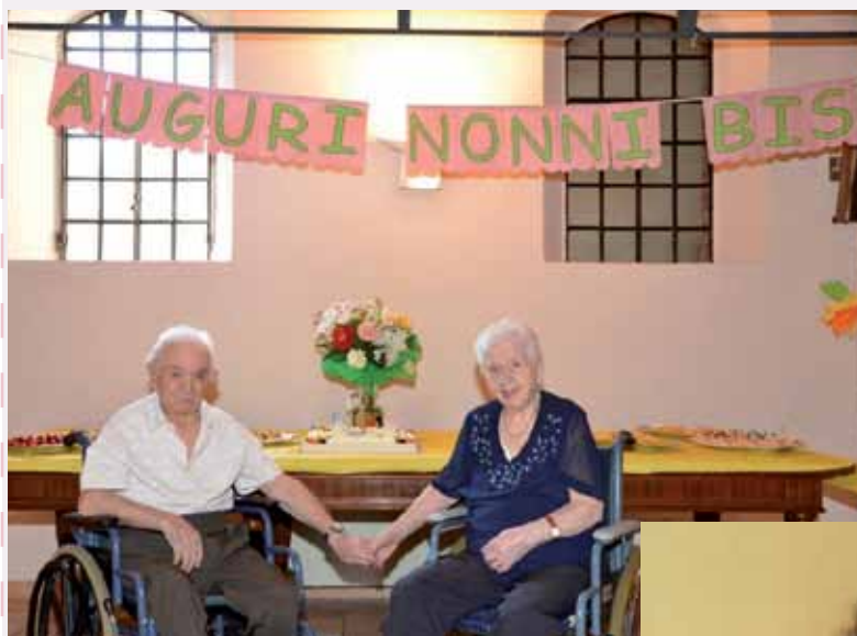
I coniugi Corti festeggiano

È un momento molto apprezzato dagli ospiti perché hanno la possibilità di sentire che hanno ancora un valore per gli altri e di poter rievocare ricordi, sentimenti ed emozioni legati al loro vissuto.